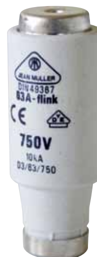
Wkładki topikowe D gF 750V

Budowa: Korpus ze steatytu, styki miedziane srebrzone, bez zawartości Cd i Pb